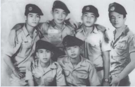
Bạn bè xưa nay ở đâu