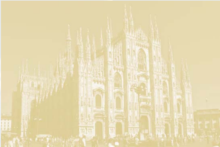
Đại thánh đường nổi tiếng của Ý

Giá tiền khá đắt vì Ý cũng dùng tiền Euro. Có chỗ tính luôn tiền tip vào hóa đơn, có chỗ không. Có một chuyện cũng nên nói tới. Khi đi xe điện giá vé rất rẻ, mua một lần, mình muốn đi đến chỗ nào cũng được. Nhưng khi đi qua trạm phải cho vé vào máy để