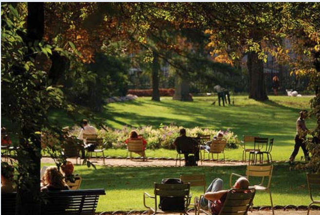
Một góc vườn “Lục Xâm Bảo”

Xuống sân bay Ý trời còn mù sương. Phi trường đã thay đổi hoàn toàn mới, chắc để tranh đua với các phi trường khác trên thế giới. Năm 1986 tôi đến Ý để dự lễ phong thánh cho các vị thánh VN. Chúng tôi đi xe điện về ga trung ương Roma. Từ đây, đổi chuyến xe tới nơi thuê khách sạn mất 15 phút xe. Từ dưới hầm lên trên đường phố, cũng ngỡ ngác như khi đến Pháp. May quá có ông cảnh sát ngay đây, hỏi đường đến khách sạn cũng dễ thôi. Khi con tôi đến hỏi thăm, ông cảnh sát trả lời không biết, tôi thắc mắc nghĩ rằng Cảnh sát mà không biết thì làm sao làm cảnh sát. Con tôi coi lại bản đồ thì thấy, ngay chỗ ông cảnh sát đứng đầu đường, chỉ đi quẹo về phía bên phải 50 thước là Khách Sạn. Tại sao ông Cảnh sát không chỉ, lý do duy nhất là kỳ thị. Giống như bên Pháp rất ghét dân Mỹ vì dân Mỹ chơi sang hơn, muốn bằng hay hơn dân Mỹ nhưng không được. Khách sạn đề 4 sao nhưng chỉ bằng cái phòng Motel ở bên Mỹ. Đường phố hoàn toàn lát đá đen, lâu năm gỗ ghề đi rất khó khăn. Khách du lịch rất đông, nhất là khu tòa thánh Vatican. Ngày nào du khách cũng xếp hàng rồng rắn để vào thăm đền thánh Phêrô. Các tượng Thánh được điêu khắc thật tinh xảo. Những cột đá cẩm thạch tròn lớn đều đặn,